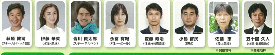
オリンピック・ムーブメントアンバサダー オリンピアン